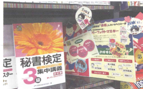
▲過去に拡材として配布したPOPを組み合わせて1枚のボードを作成！