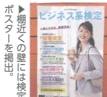
▶近くの壁には検定ポスターを掲出!

テーマが青空ということで、飾り付けの規模が大きくインパクトがありますね!雲や風船の装飾がとてもいいアクセントになっています。リーフレットやポスターなど、拡材をフル活用していただいている点も評価させていただきました。