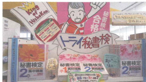
◀手書きのボードとアレンジしたパネルが目を引きます！