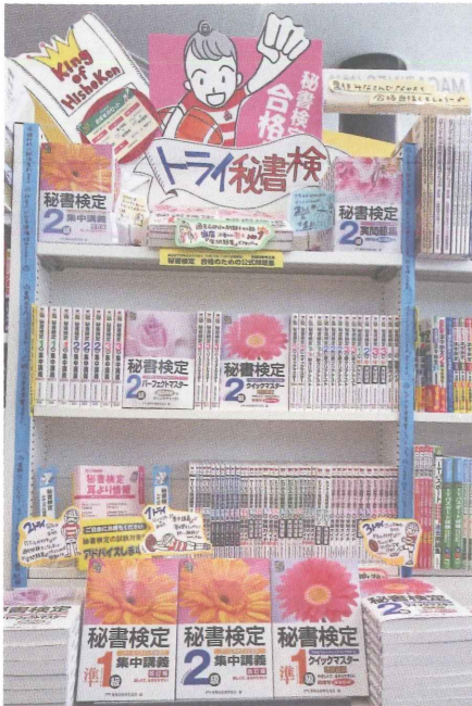
▲ラグビーワールドカップをテーマにした飾り付け！