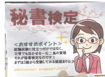
▲秘書検定受験を勧める書店様のオリジナルポスター。