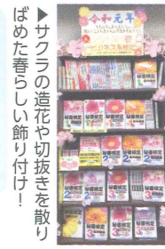
▶サクラの造花や切抜きを散りばめた春らしい飾り付け! ▲リーフレットと葉も添えました。