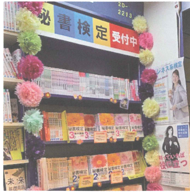
▲ペーパーフラワーやカラフルなボードで彩られた明るい売場。照明の演出もgood！

工夫をこらしたペーパーフラワーは、確かに花びらが映えますね！また、「秘書検定受付中」というカラフルなボードを作成したり、照明を取り付けて売場を明るく演出する工夫がよかったです。