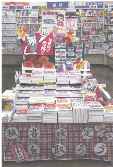
▲エンド台での大展開は迫力満点!