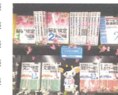
▲初参加の酪農学園大学生協様！