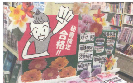
▲書籍表紙の花とタイトルを拡大してPR!