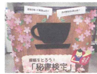
▲コンセプトは「おしゃれなカフェ」。コーヒーカップの切り抜きをアイキャッチとして活用。

おしゃれなイメージで本を展開してみたいと思い、木の背面を作成し、コーヒーカップやサクラの花や木を散りばめてみました。コーヒーカップはパートさんが作成してくださり、サクラの飾り付けもどのように目立つかを皆で話し合い決めました。これからは学生に「楽しい」と思ってもらえる店舗にしていきたいです。