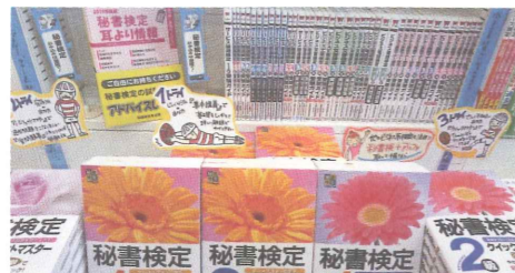
▲POPでテキストの特長を紹介！イラストがおもしろいですね～