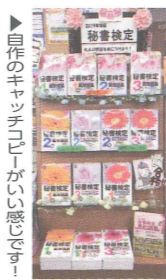
▶「自らのキャンパス」が嬉しい感じですね!

女子大生がターゲットなので、かわいらしく見えるようにカラーペーパーで作った花やガーランドを飾りました。実は、こちらのお店に採用してから日も浅かったので、自分にとっては初めて任された大役でした。