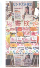
▲売れ筋問題集はPOPで強調

全体的に春らしく、パステルカラーでまとめる工夫をしました。また、書籍を立てて陳列したかったので、その台をダンボールから手作りしました。足を止めて書籍を手にとられるお客さまを多く見かけました。