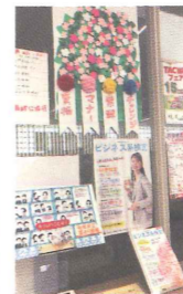
▲当社が配布したリーフレットのマンガをボードとして活用。