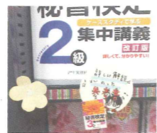
▲丸型のPOPは自作イラスト付きで親しみがわきます！

自作イラスト付きのPOPがかわいいですね～！遠目からでも自然と目が行ってしまいます。棚上部にある折り紙の飾り付けは、いいアクセントになっていますね。そのほか、拡材として書店様に配布しているPOPを上手く活用し1枚のパネルにしたアイデアも良かったです！おめでとうございます。