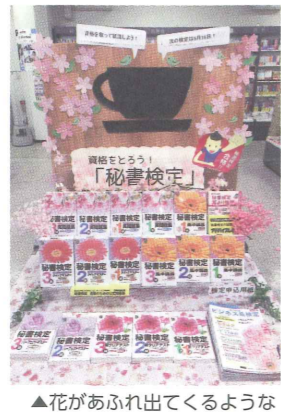
▲花があふれ出てくるようなフェア展開!