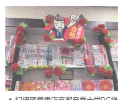
▲紀伊屋書店京都産業大学BC様