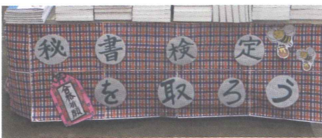
▲当社が配布した葉の柄を取り入れた棚下の飾り付け。目立ちますね!

秘書検定の華やかさを表現したいと思い、花や生き物がたくさんある装飾にしました。また、どのような種類の書籍があるかを明確にするため、タイトルを張り出しました。売場の周りは拡材で送られてきた葉の柄を取り入れました。フェア展開後は、数人で来店されたお客さまの中で、後日パンフレットをお持ち帰りになったり、「日常生活に生かせるなら受けてみようかな」と売場の前で話されているお客さまを見かけました。今回、売場の展開方法やPOPがいかにお客さまの目に留まっているのかを改めて確認できました。