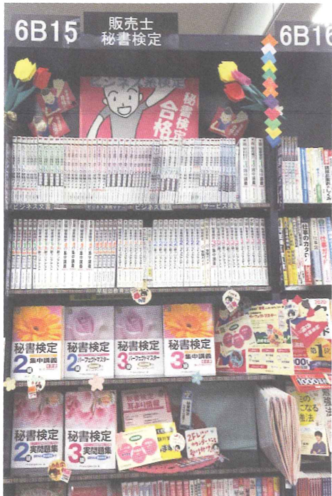
▲とにかく目立つように意識したという飾り付け！

お客さまに少しでも立ち止まって見ていただけるように、全体的に「かわいく」、「明るく」、「目立つ」展開をテーマにしました。立ち止まって見てくれた方が多くいました。